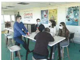
Des moments d'échange entre étudiants