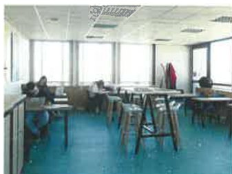
Un grand espace de travail et d'étude