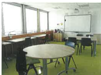
Des espaces de travail collaboratif